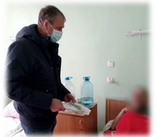
Доставка препаратів АРТ, Дніпропетровська область