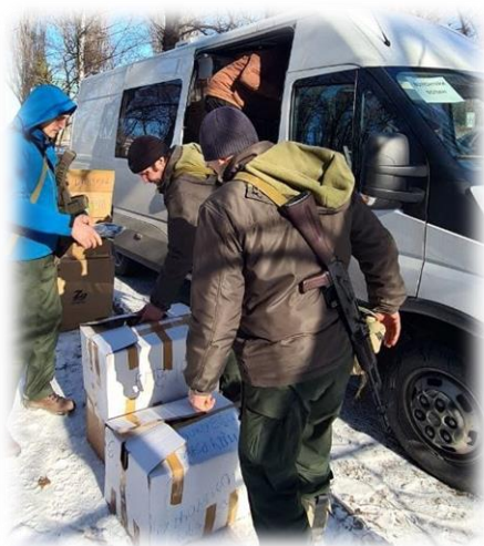
Підготовка до перевезення гуманітарного вантажу мобільною амбулаторією Альянс

Альянсом прийняте рішення про надання мобільних амбулаторій, які знаходяться на балансі організації для гуманітарних потреб - евакуації найбільш уразливих категорій населення, жінок та дітей, доставки продуктів та медикаментів! Цілодобово вони працюють, доставляючи гуманітарні грузи з Західної України до Києва та сходу.