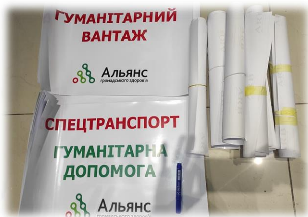
Тепер наші буси матимуть спеціальні наклейки