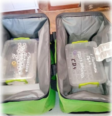
Транспортування зразків крові на CD4, Дніпропетровська область