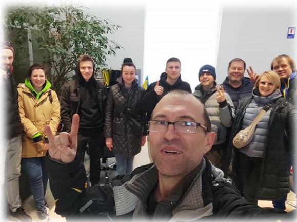
Команда гуманітарного патруля Альянс

Всього було проведено три виїзди гуманітарного конвою Київ-Львів-Київ (7 машин, орієнтовно 42 тони вантажу), три виїзди за маршрутом Київ-Луцьк-Київ (3 машини, орієнтовно 18 тон вантажу). Гуманітарні вантажі доставляються на склад у Києві з подальшим розвезенням по НУО, ТРО, лікарнях тощо. Окремо, поза складом, поставляються ліки та гуманітарка до Броварів (центральна районна лікарня), Козелець та інші гарячі напрямки в бік Чернігова.