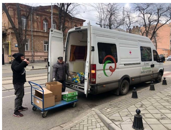
Гуманітарний вантаж в Одесі

Також робота багатьох партнерських організацій переформатована на надання гуманітарної допомоги . За погодженням з Альянсом, для розвезення гуманітарних вантажів використовуються мобільні амбулаторії, також завдяки перерозподілу коштів закупляються гуманітарні вантажі. Партнерська організація «Соціальні ініціативи з охорони праці та здоров'я», завдяки оперативному реагуванню Альянсу та зміні цільового призначення наявних коштів і спрямування їх на гуманітарну підтримку, зібрала нагальні потреби у забезпеченні гуманітарних потреб та організує закупівлі та відвантаження необхідної продукції. Допомога орієнтована на клієнтів соціальних служб, що звертаються за допомогою і мають дітей. Цінні гуманітарні вантажі вже доставлені у Київ, Рубіжне, Северодонецьк, Слов'янськ, Кременну, Добропілля, Херсонську область. Вони містять продукти, ліки, дитячі підгузки.