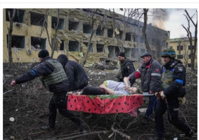
Співробітники швидкої допомоги та волонтери вивозять поранену вагітну жінку з постраждалого в результаті обстрілів у Маріуполі пологового будинку. Незабаромі жінка та її дитина померли.