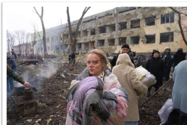
Результат обстрілу пологового будинку в Маріуполі 9 березня

З початку російської агресії Маріуполь (населення станом на 2021 рік - 431 859 осіб) перебуває у блокаді російських окупаційних військ. За даними Маріупольської міськради станом на 14 березня кількість загиблих мирних жителів у зв'язку з вторгненням Росії в Україну становить понад 3 тисячі осіб і постійно збільшується, точні дані надати нереально через постійні обстріли міста і його облогу. За даними міністра з питань тимчасово окупованих територій України Ірини Верещук станом на зараз у місті залишаються понад сто тисяч громадян. У місті наразі гуманітарна катастрофа, у місті не залишилось непошкоджених будівель. Велика кількість людей, не отримуючи медичної допомоги, не маючи їжі, не маючи води, вмирає. Бої за місто тривають.